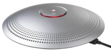
紅光亮起充電完成